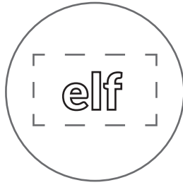
Wydrukowane karty ze słowami (Karta Pracy)