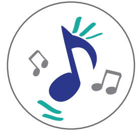
Świąteczna muzyka (jeśli jest możliwość jej poprawnego odtworzenia)