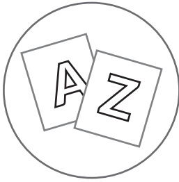
Wydrukowane karty z literami (Karta Pracy)